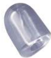
17 gr HOLLOW ICE CUBE