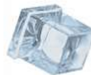
6 / 10 / 17 gr SQUARED ICE CUBE 10 gr.= Standard